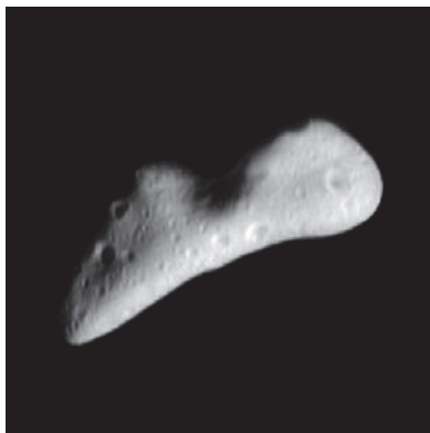
El Asteroide Eros a 1.561 Km. de distancia

onda de choque causada por el impacto. La superficie del mar se vuelve roja con la sangre de estos animales cuando sus órganos internos explotan.