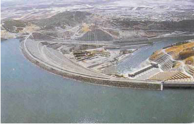
Represa de Ataturk en el río Eufrates

En Apocalipsis 16:13-14 , Juan vio a tres espíritus inmundos a manera de ranas saliendo de las bocas del dragón (Satanás), la bestia (el gobernador del mundo) y el falso profeta. Estos eran espíritus demoníacos, capaces de hacer señales y engañar con maravillas, como lo vemos en Tesalonicenses 2:9