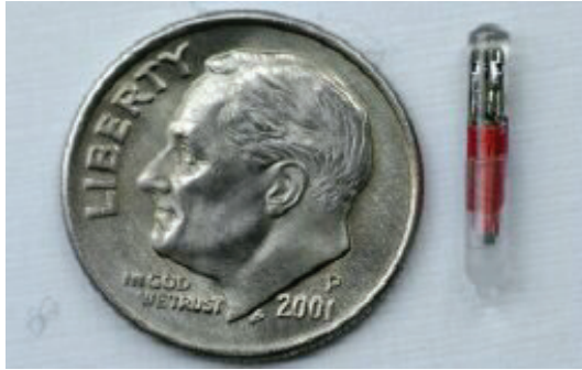
Comparacion del tamaño de un Verichip con Diez centavos de dólar

¿Cómo se relaciona todo esto con la bestia o el gobernador del mundo? El falso profeta obligará a las personas a ser inyectadas con este microchip que contendrá sus identidades y probablemente sus informaciones personales y médicas. Este chip será programable desde un satélite en órbita, y no solamente una persona en particular podrá ser localizada por el Sistema de Posición Global (GPS), sino que su comportamiento podrá ser alterado con una simple orden desde el espacio. Desde luego el gobernador del mundo implementará este sistema para controlar a todos , pero además buscará identificarse como el “Cristo” o el “Ungido”. Es mi opinión que él será conocido por tres nombres, y las iniciales corresponden a chi , xi , stigma . El primer nombre podría ser “Cristóbal” (del Griego Christoforos , de Cristos ; que significa Aquel que lleva a Cristo consigo ). El segundo nombre empezaría con xi , y podría ser la palabra “Xenos” (extraño, de fuera, foráneo; que implicaría una criatura celestial). El último nombre empezaría con stigma , y podría ser la palabra “Estigma”. Ya que varios personajes históricos han sido conocidos por sus primeros nombres y características físicas o de comportamiento; como por ejemplo, los hijos de Carlomagno, Carlos el Calvo y Luís el Gordo, y uno de los primeros reyes de Inglaterra, Ethelred el “Redeless” (que ingles significa el tonto), el gobernador del mundo sería