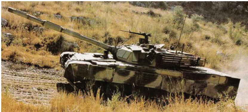
Tanque Principal de Batalla Chino Tipo 90

La descripción de los “caballos” en la visión, sobre los cuales los hombres cabalgaban, encaja exactamente la descripción de los tanques modernos. Los tanques fueron los vehículos que se usaron para transportar a los soldados del ejército Ruso en la Segunda Guerra Mundial cuando obligaron al ejército Alemán a retroceder hacia Berlín. Los tanques Rusos estaban tan atestados con soldados, que algunos cayeron de los tanques y fueron aplastados por los tanques que venían atrás. Recuerde que el apóstol Juan nunca había visto otro vehículo que no haya sido un carro tirado por caballos. Para él, cualquier cosa sobre la cual el hombre podía montarse era solo un caballo “grande.”